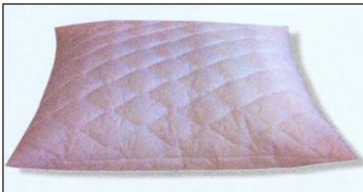
<< Hoofdkussen "CLINIC"