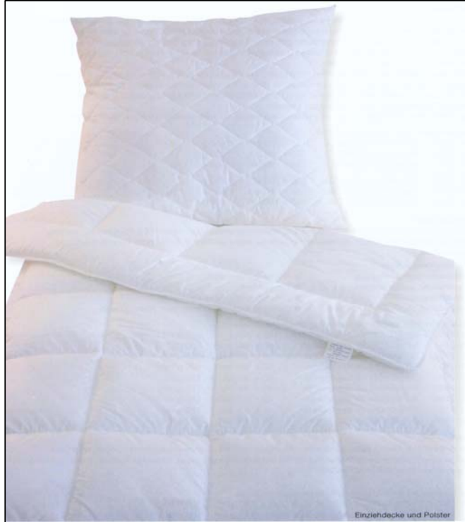
<< Dekbed "CLINIC"